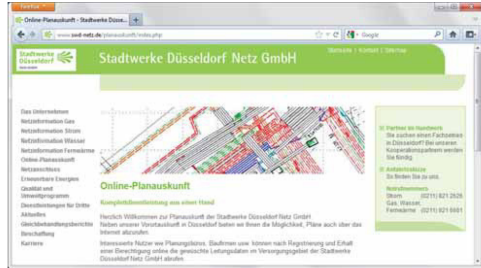
Bild: Start der Online-Planauskunft auf der Website der Stadtwerke Düsseldorf Netz GmbH

Am 25. Januar 2012 wurde die neue Online-Planauskunft im Stammsitz am Höherweg 100 in Düsseldorf vorgestellt. Hierzu waren rund 90 Anwender verschiedener Baufirmen, Ingenieurbüros und der Stadtverwaltung Düsseldorf eingeladen. Nachdem Funktionsweise und Bedienung der Internetplanauskunft erläutert waren, hatten die anwesenden Gäste die Möglichkeit, zu Testzwecken selbst eine Online-Planauskunft zu erstellen, was Raum für fachliche Diskussionen in entspannter Atmosphäre bot.