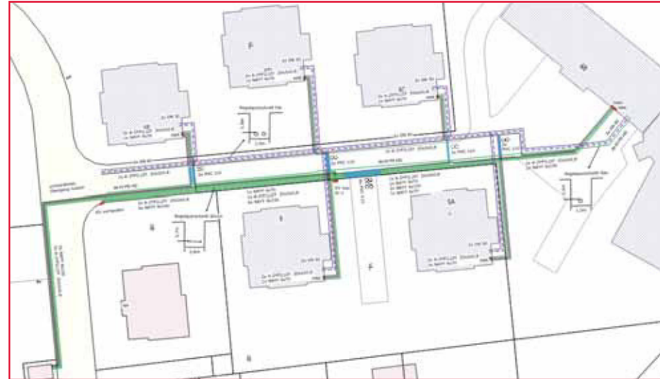
Bild: Erstellung einer Fernwärmeplanung mit dem Modul DESIGN bei den Stadtwerken Gießen

Nach der Genehmigung der Maßnahme erfolgt eine Feinplanung. Hierzu wird neben den detailliert vorliegenden topographischen Informationen auch noch das Kanalnetz als Planungsgrundlage erfasst. Auf dieser Basis erfolgt dann die genaue Planung der einzelnen Sparten, die in der Regel alle in einem Planwerk gemeinsam im Maßstab 1:250 dargestellt werden. Neben dem Leitungsverlauf werden auch die wesentlichen Betriebsmittel wie Armaturen, Hydranten und Schieber eingebracht. Eine Planung der Anschlüsse erfolgt nur bei Bedarf, z.B. wenn diese umgehängt werden müssen.